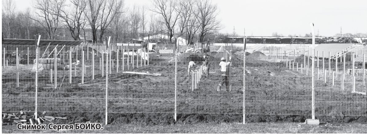
Снимок Сергея БОЙКО.

На одном из полей возле станции Ханской с ноября прошлого года ведется строительство объекта, похожего на космический корабль. Однако в республиканском Министерстве экономического развития и торговли пояснили, что там полным ходом идет строительство первой в республике Адыгейской солнечной электростанции.